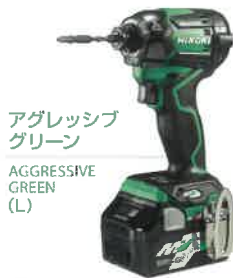
アグレッシブ グリーン AGGRESSIVE GREEN (L)