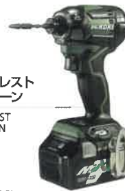
フォレスト グリーン FOREST GREEN (G)