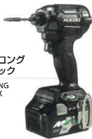
ストロング ブラック STRONG BLACK (B)