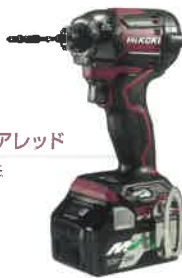
フレアレッド FLARE RED (R)