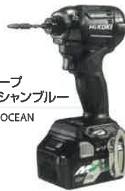
ディープ オーシャンブルー DEEP OCEAN BLUE (D)